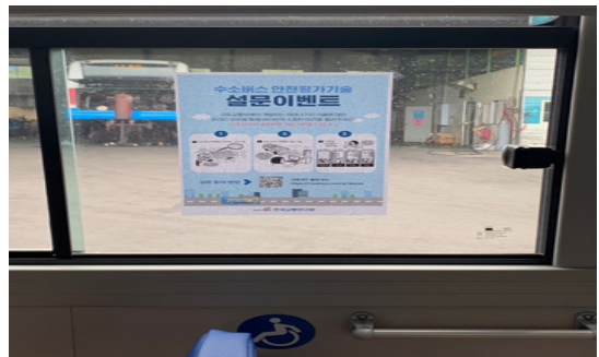
Fig. 2 Example of attached guide to survey within bus