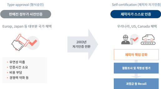
Fig. 2 Type-approval and Self-certification 10)