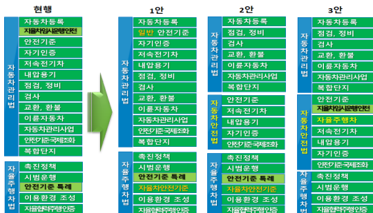
Fig. 5 Improvement of the autonomous vehicle safety legal system

첫째는 「자동차관리법」은 자동차안전에 관한 일반기준을 규정하고, 「자율주행자동차법」에서 자율주행과 관련