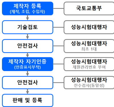
Fig. 4 Self-certification process of small manufacturer 18)

기준적합인증으로 구성되는데, 17) 소규모제작자등의 자기인증은 “정부가 지정하는” 성능시험 대행자 가 (정부가 규정한) 안전기준에 적합함을 확인하여 승인하는 절차를 거쳐야만 자동차를 판매할 수 있는 강제인증제도로서, (법문의 표현과는 달리) 자기인증이 아니라 형식승인으로 보아야 할 것이다.